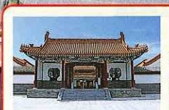
燕趙門(엔초몬)과 影壁(에이헤키) 엔초엔(燕趙園)의 주요 출입구. 황제의 색을 나타내는 남색 기와를 올려서 당당한 분위기를 나타냈습니다.

휠체어를 희망하시는 분은 입장하실 때에 접수처(燕趙門) 옆에 신청하여 주십시오.