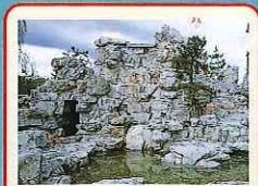
天池山(덴치산) 돌산(石山)의 정상에 작은 연못이 있어서 명명되었습니다. 돌산(石山)은 허북성(河北省)·연산펑(燕山峽) 절벽의 돌을 사용했습니다.