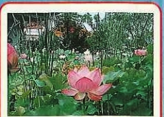
荷池(하스이케) 사면호풍루(시멘카후사)에서 바라보는 荷池(연못)는 불만입니다. 절경기는 7월 중순~8월 중순