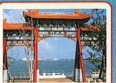
迎水坊(게스이보) 황제가 뱃놀이를 즐기 위해 배를 탈 때의 선착장을 이미지 해서 만들어진 것으로 황제를 맞이하는 문입니다.