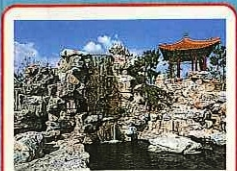
飛雲瀑(하운바쿠) 뒤어나오는 운무처럼 흘러 쏟아지는 폭포입니다.