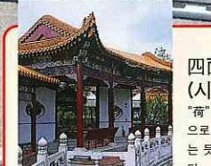
四面荷風榭(시멘카후사) “荷”란 연꽃을 말합니다. 연꽃 옆으로 둘러싸인 수면에 마치 떠있는 듯한 분위기를 느끼게 해 줍니다.