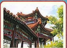
一覽亭(이치란테이) 엔초엔(燕趙園)에서 가장 높은 위치에 있어서 정원의 모든 경치를 한눈에 볼 수 있습니다.