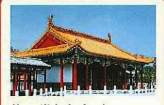
華夏堂(가카도) 엔초엔(燕趙園)의 중심 대전(大殿)으로 수많은 종류의 동물 이외에도 황제의 심벌인 금옹이 다수 그려져 있습니다.