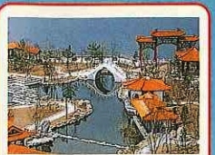
七星橋(나나호시하시) 커다란 아치형의 교각은 일곱색상 무지개를 재현하고 있습니다.