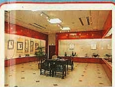
슈스이칸(集粹園) (이벤트홀·전시홀) 경극·중국 악기연주·중국 서화 등이 전시되어 있습니다.