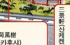
三景軒사케켄 돌로 만든 의자에 앉으면 창 밖으로 가우사(荷風榭)·가카도(華夏堂)·이치란테이(一覽亭)의 세가지 경치를 볼 수 있습니다.